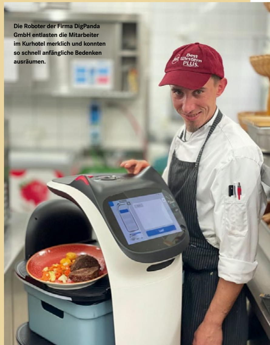
Die Roboter der Firma DigPanda GmbH entlasten die Mitarbeiter im Kurhotel merklich und konnten so schnell anfängliche Bedenken ausräumen.

Allerdings – auch die Mitarbeiter hatten zunächst Scheu vor der neuen Technik. Weniger aus Sorge um ihren Arbeitsplatz als aus der Befürchtung heraus, ob sie mit den Robotern wirklich umgehen und sie richtig bedienen können. Deshalb gab die Hotelleitung ihnen schon vor der Anschaffung Videos an die Hand, damit sie sehen konnten, wie die Geräte funktionieren. Das hat die Anspannung in Neugierde umgewandelt. Auch die Geschäftsführung von DigPanda stand vor Ort zur Verfügung und konnte eventuelle Bedenken ausräumen. „Die Roboter sind intuitiv und leichter als ein Tablet oder Smartphone zu bedienen“, erklärt Poth.